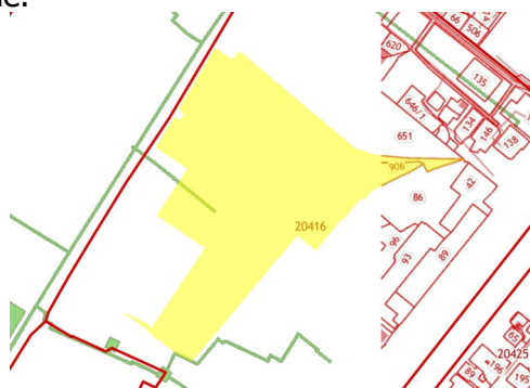
Рисунок – Конфигурация земельного участка

1. Земельный участок с кадастровым номером 26:21:020416:906, расположенный по адресу: Ставропольский край, город Буденновск, ул. Строительная, площадью 121 484 кв. м., категория Земли населённых пунктов, вид разрешенного использования - под промышленное предприятие.