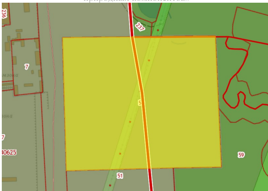
Рисунок: Конфигурация земельного участка

Инвестиционный проект: «Создание производства косметических средств из целебных природных компонентов»